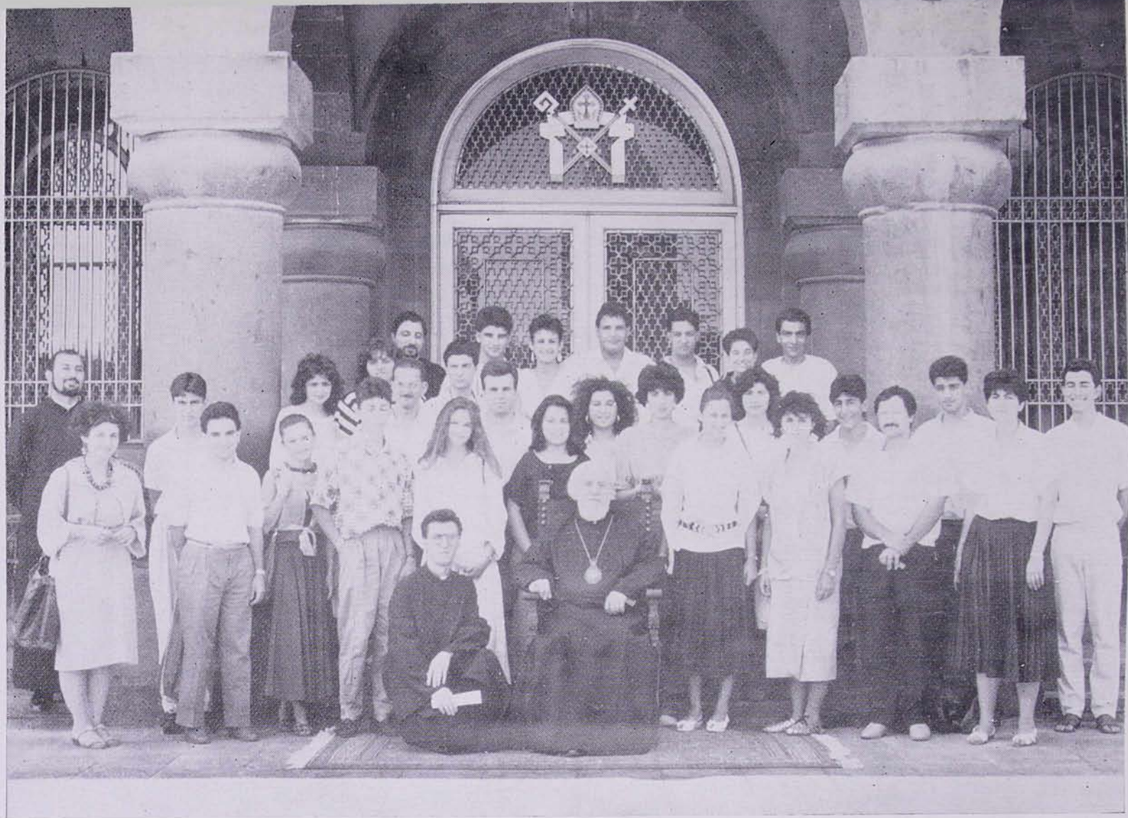
ՎԵՎՈՒՄ ԿԱՅՐԱՊԵՏԸ ՄԱՅՐ ԱԹՈՒՄ ԿՐԱՎԵՐՈՎ ԼԻՈՆԻՅ ՄԱՅՐ ԿԱՅՐԵՆԻՔ ԱՅՅԵԼԱԾ ՈՒՍԱՆՈՂՆԵՐԻ ԿԵՏ