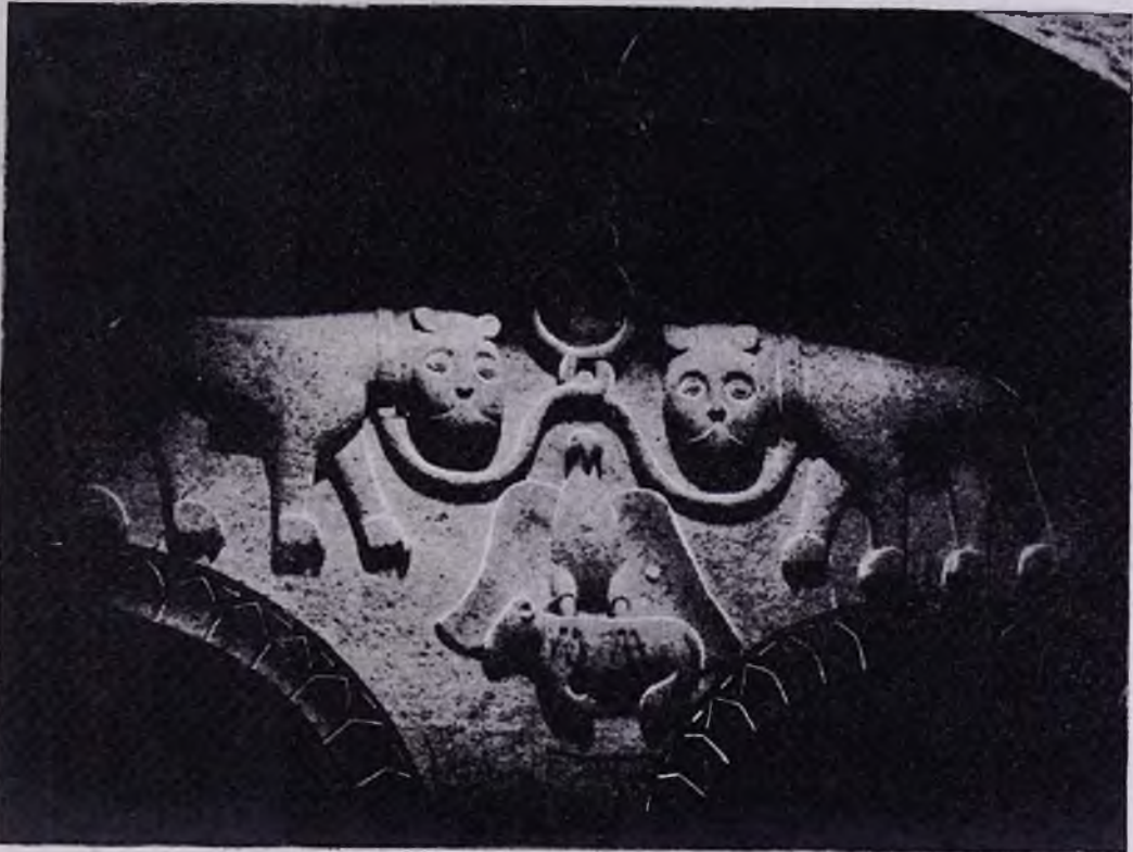
Քարձրաբանդակ առյուծներ Գեղարդում (Պոռչյանների զինանշանը)

Հայրենի կախարդիչ բնության դիմաց, հայրենասեր բանաստեղծը հայացքը շորս